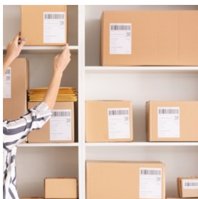
Dans les bureaux de poste