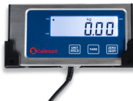
Écran facile à lire

La balance à paquets S170 de Scaleson est particulièrement convaincante en raison de sa simplicité d'utilisation. Les fonctions standard de marche/arrêt, de pesage et de tarage peuvent être commandées avec seulement deux touches. Lors du tarage, les poids supplémentaires non désirés tels que les emballages ou les conteneurs sont soustraits. La troisième touche offre la possibilité de passer des unités de kg à lb ou de stabiliser une valeur de poids éventuellement instable grâce à la fonction de maintien.