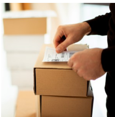
Dans le transport