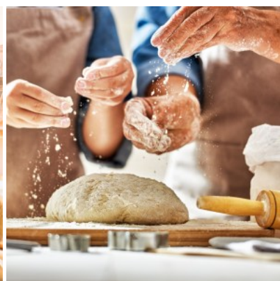
Dans le ménage

La balance compacte S110 de Scaleson peut également convaincre dans le commerce de détail et sur les marchés. En tant que trieuse pondérale, elle peut être utilisée ici pour un contrôle rapide et facile du poids des aliments, des ingrédients et d'autres produits.