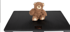
Utilisation comme balance pour petits animaux