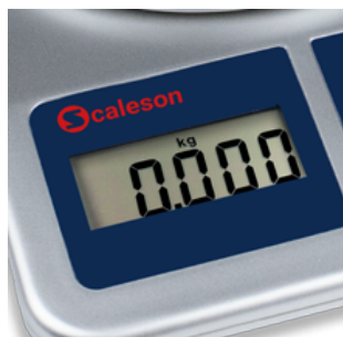
Gut ablesbares Display

Mit den zwei Tasten „TARE/ON“ und „OFF“ kann die Waage sehr einfach bedient werden. Die Trierfunktion ermöglicht die Ermittlung des Nettogewichtes, z.B. ohne Verpackung. Mit der Einheitentaste „UNIT“ kann die Einheit von kg auf lbs geändert werden.