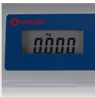
Gut ablesbares Display

Mit den zwei Tasten „ON/TARE“ und „OFF“ kann die Waage sehr einfach bedient werden. Die Taringfunktion ermöglicht die Ermittlung des Gewichtes ohne Behältnis. Mit der Mode-Taste kann die Einheit von kg auf lbs geändert werden.