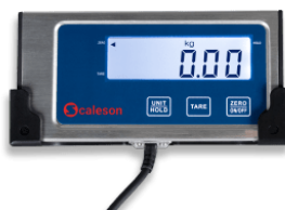
Gut ablesbares Display

Die Scaleson Paketwaage S170 überzeugt vor allem durch Ihre einfache Bedienung. Mit nur zwei Tasten können die Standardfunktionen Ein-/Ausschalten, Wiegen und Trieren bedient werden. Beim Trieren werden ungewünschte Zusatzgewichte wie z.B. Verpackungen oder Behälter abgezogen. Die dritte Taste bietet die Möglichkeit der Einheitenumschaltung von kg auf lbs oder einen eventuell unruhigen Gewichtswert per Hold-Funktion zu stabilisieren.