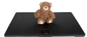
Nutzung als Kleintierwaage